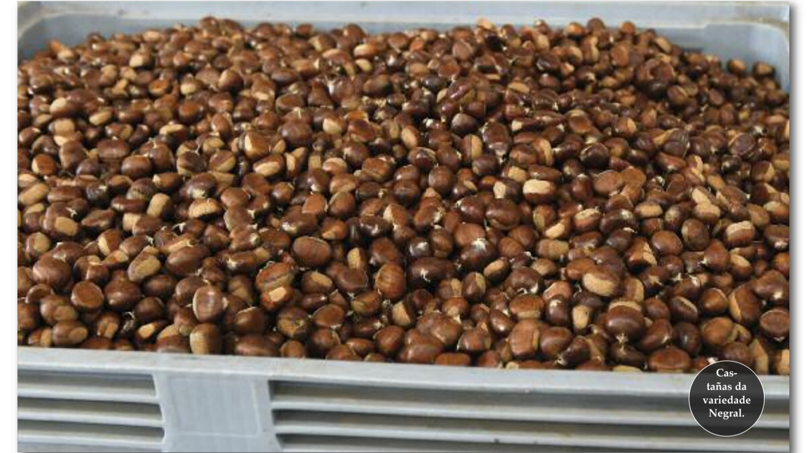
Castañas da variedade Negral.