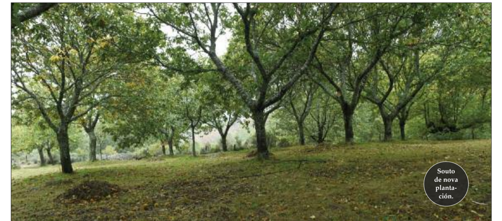
Souto de nova plantación.

Amarelante, Famosa, Garrida, Longal, Negral, De Parede, Xudía e Ventura son, segundo un estudo, as variedades de mellores características tecnolóxicas e produtivas para pór en novos soutos