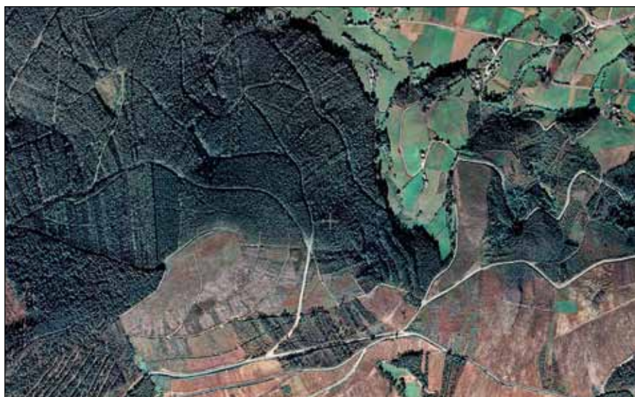
Ortofoto de usos do solo no norte de Galicia. A zona inferior apréciase sen arborado, en contraste coa zona esquerda e superior arborada, e na que se realizou un proceso de concentración da propiedade