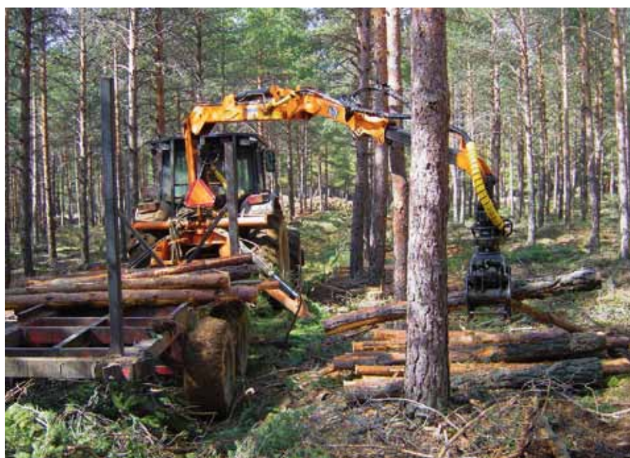
Aproveitamento con procesadora nun piñeiral

Neste decreto créase o citado Rexistro de Sociedades de Fomento Forestal como un rexistro público de carácter administrativo adscrito á Consellería do Medio Rural, e especifícanse as condicións que deben cumprir as sociedades para poder inscribirse