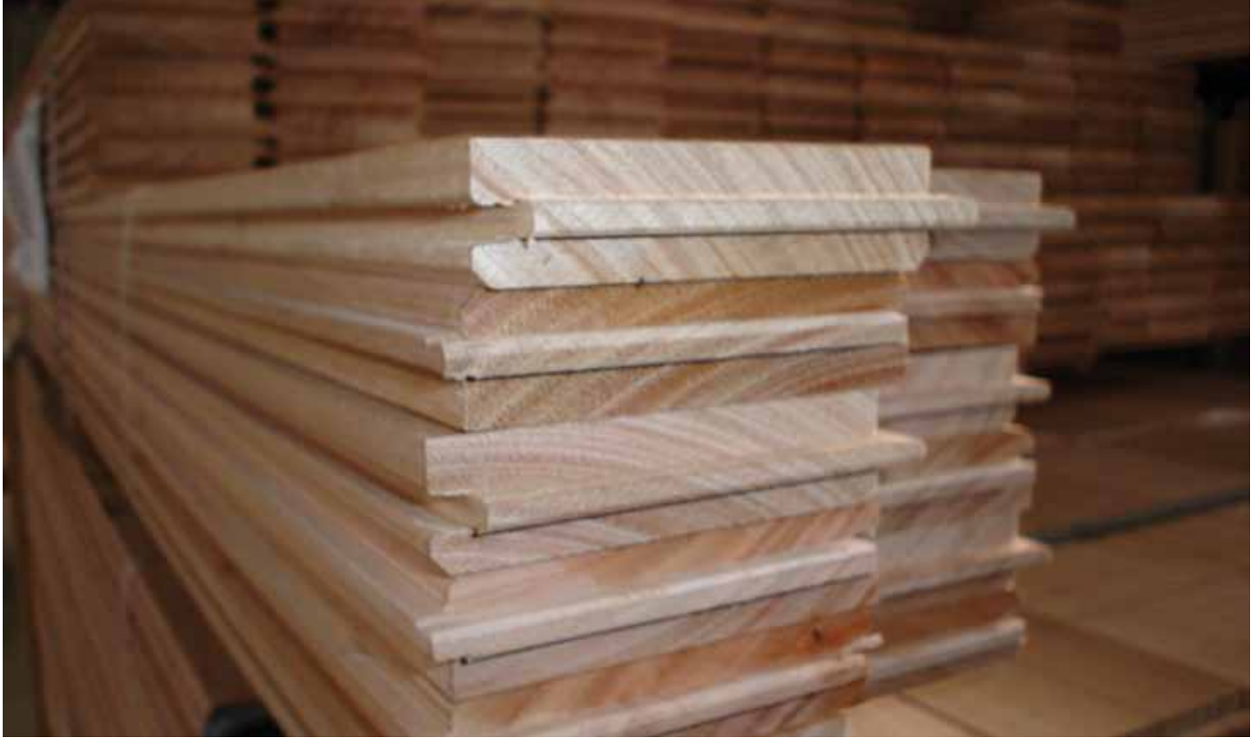
Produto elaborado en madeira de eucalipto

e acceder ás axudas públicas específicas. Trátase de sociedades limitadas constituídas polos propietarios forestais para xestionar conxuntamente as súas propiedades e ás que poden dar entrada, se o estiman conveniente, a socios que acheguen capital, sen perder nunca a maioría na toma de decisións. Así, aquelas sociedades limitadas que cumpran os requisitos necesarios pódense inscribir no rexistro de Sofor e, a partir dese momento, a Xunta de Galicia recoñécelles un especial interese forestal.