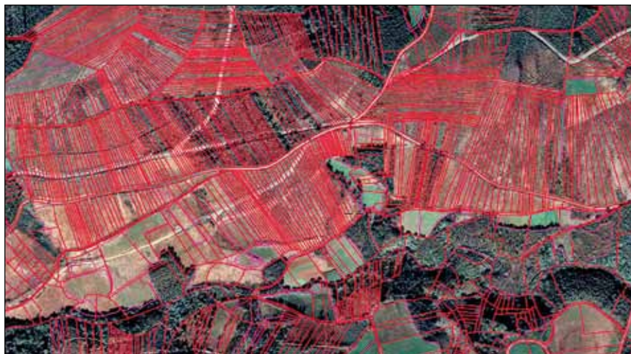
Parcelario superposto a ortofoto. Exemplo do minifundismo

De acordo cos datos do Instituto Nacional de Estatística (INE), no ano 2010 había en Galicia 198.874 empresas das que a maior parte (112.233) eran persoas físicas, mentres que do resto a gran maioría eran sociedades de responsabilidade limitada (64.672).