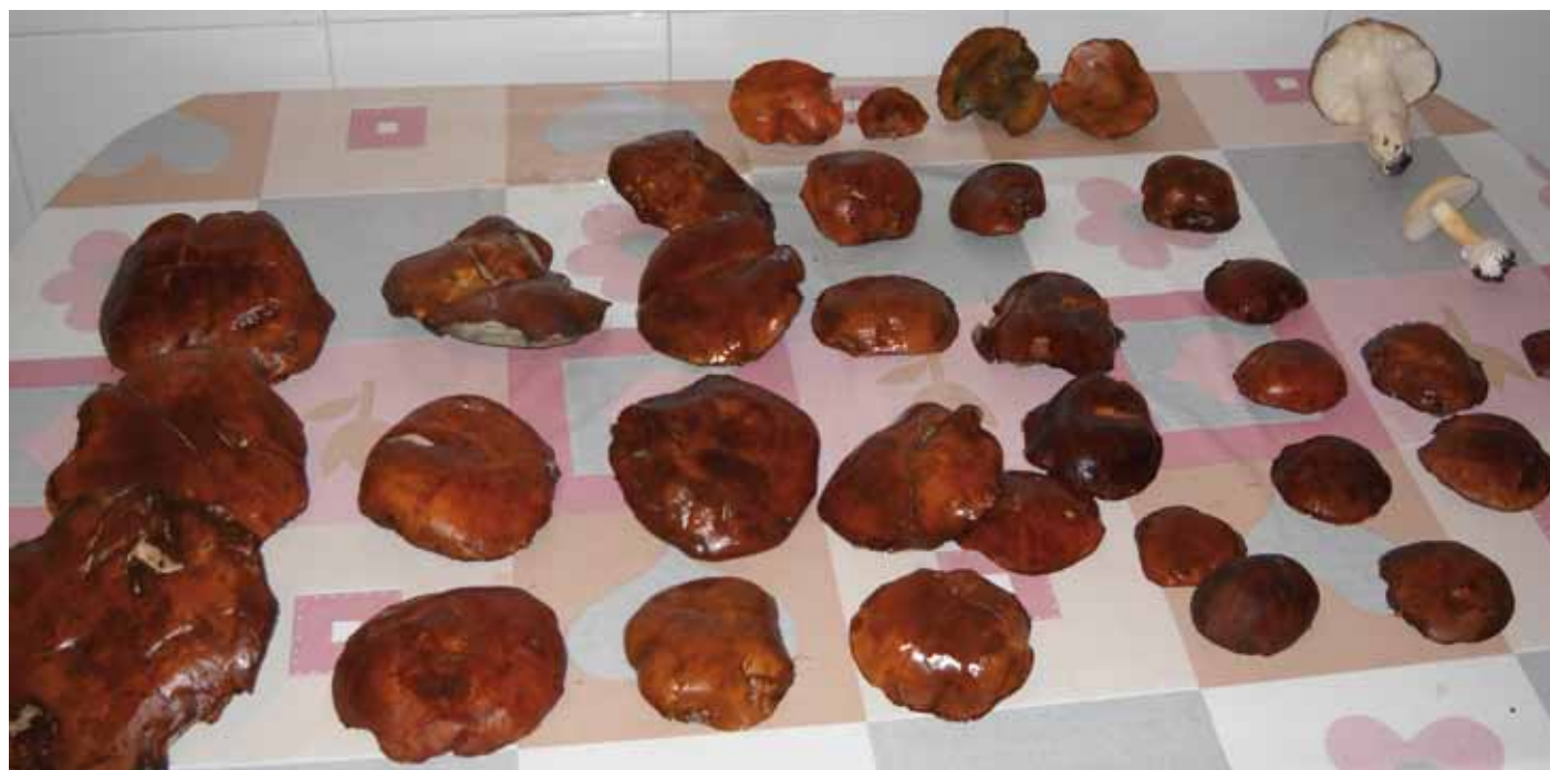
Cogomelos recolectados en bosques galegos

2. Calquera persoa física ou xurídica pode ser socia dunha Sofor, con independencia de que teña a propiedade forestal ou non, e para conseguir unha xestión conxunta de varias explotacións, a sociedade deberá contar como mínimo con tres persoas socias, sen que ningunha delas poida superar unha terceira parte do capital. As entidades públicas —Comunidade Autónoma de Galicia, entidades locais ou sociedades públicas